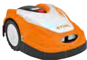
iMOW® MÄHROBOTER RMI 422

Vollautomatischer Mähroboter für Rasenflächen bis 800 m². Schneidet, zerkleinert und düngt als Mulchmäher in einem Arbeitsgang. Schnittbreite: 20 cm, max. Steigung: 35 %.