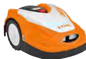
iMOW® MÄHROBOTER RMI 422 P

Vollautomatischer Mähroboter für Rasenflächen bis 1.500 m². Schneidet, zerkleinert und düngt als Mulchmäher in einem Arbeitsgang. Schnittbreite: 20 cm, max. Steigung: 40 %.