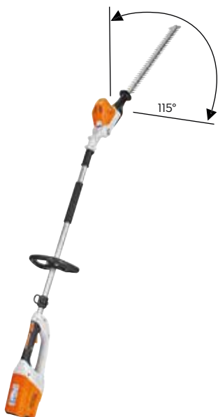
HLA 65 OHNE AKKU UND LADEGERÄT