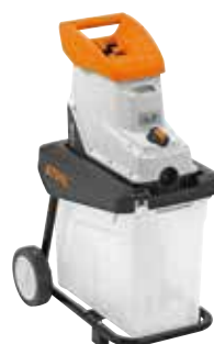
GHE 140 L