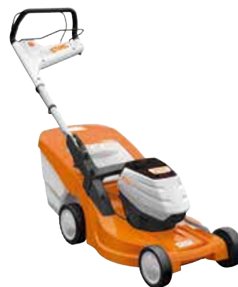
RMA 448 PC OHNE AKKU UND LADEGERÄT