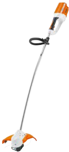
FSA 65 OHNE AKKU UND LADEGERÄT